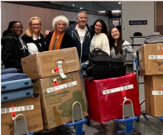
L'équipe de MMS quittant l'aéroport de Montréal, transportant du matériel médical généreusement offert par nos partenaires.

Nous tenons à remercier sincèrement tous nos donateurs dont la générosité rend notre travail possible. Nous sommes particulièrement reconnaissants aux compagnies qui nous fournissent de l'équipement chirurgical essentiel, notamment Cardinal Health et Storz Canada , pour leur soutien continu.