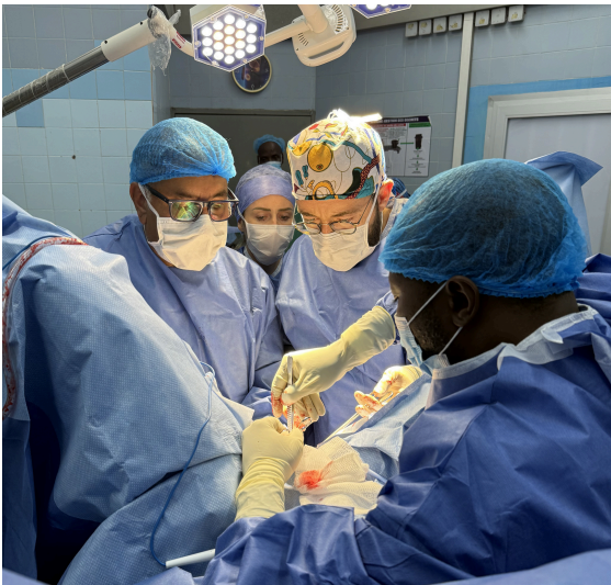
Des chirurgiens de MMS travaillant aux côtés de collègues togolais.

En 2025, 30 femmes ont reçu des chirurgies réparatrices de fistules . Toutes nos patientes des missions précédentes sont aussi vues pour un suivi et plusieurs nouvelles patientes ont été examinées, soit pour les préparer à une mission future ou pour leur offrir un traitement à l'aide de médicaments.