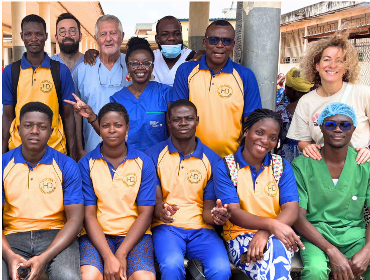
L'équipe de MMS avec l'équipe d'Horizon Développement.

Nous avons continué notre partenariat avec l'ONG locale Horizon Développement qui recrute les patientes, dispense des formations sur la prévention des fistules et gère toute la coordination locale avant, pendant et après nos missions chirurgicales.