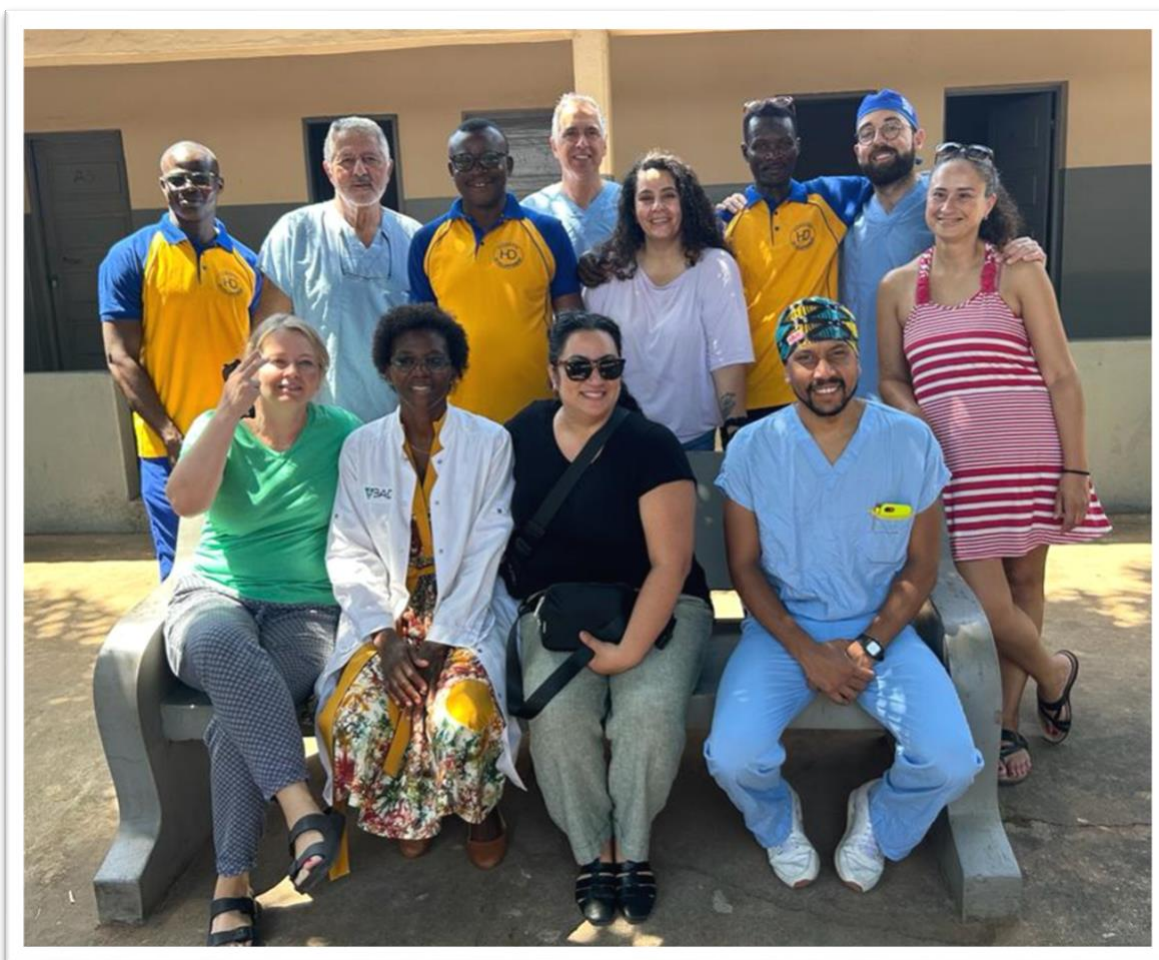
L'équipe de MMS au complet avec l'équipe de l'ONG Horizon Développement.