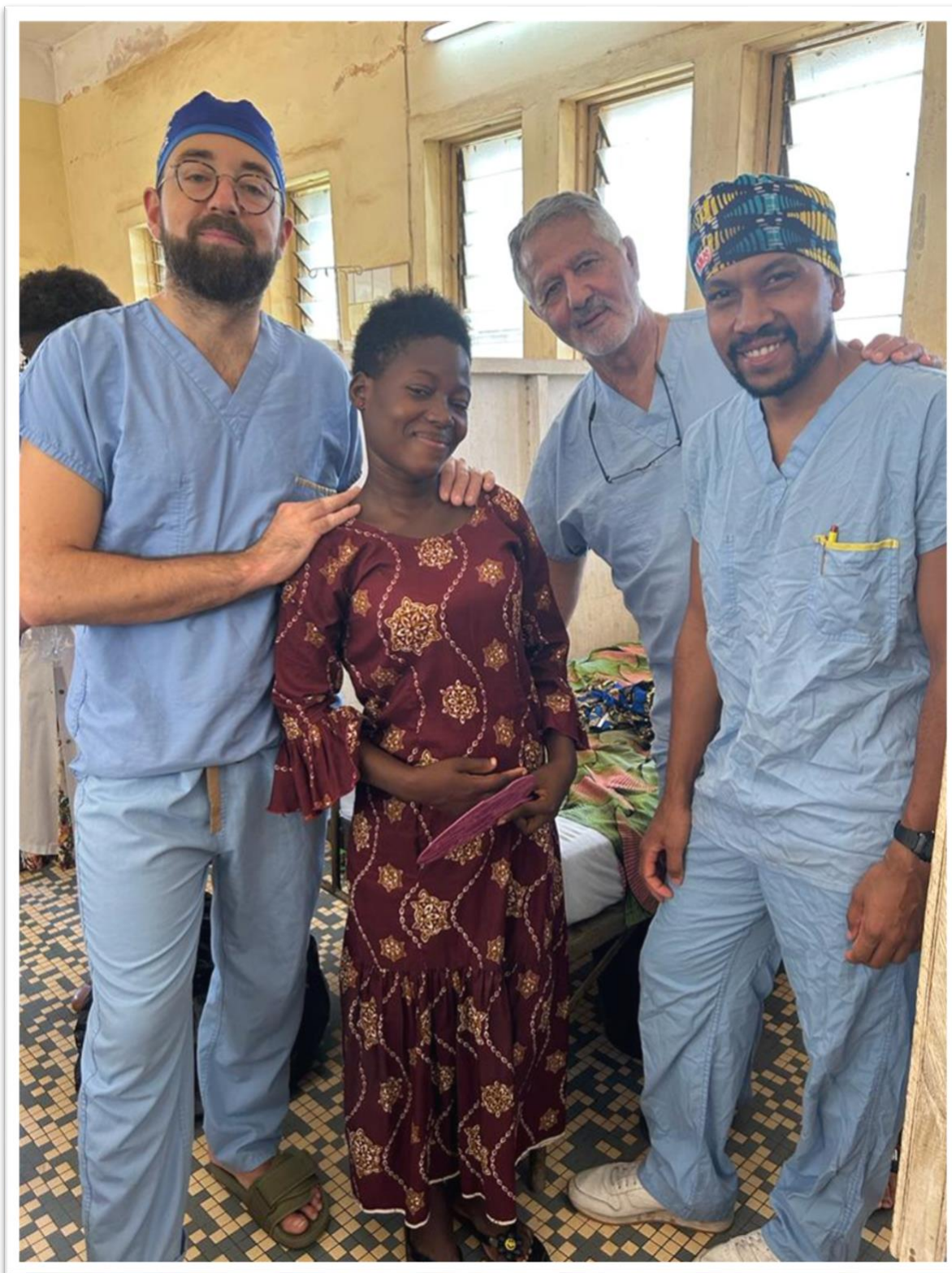
Les chirurgiens avec une patiente heureuse.