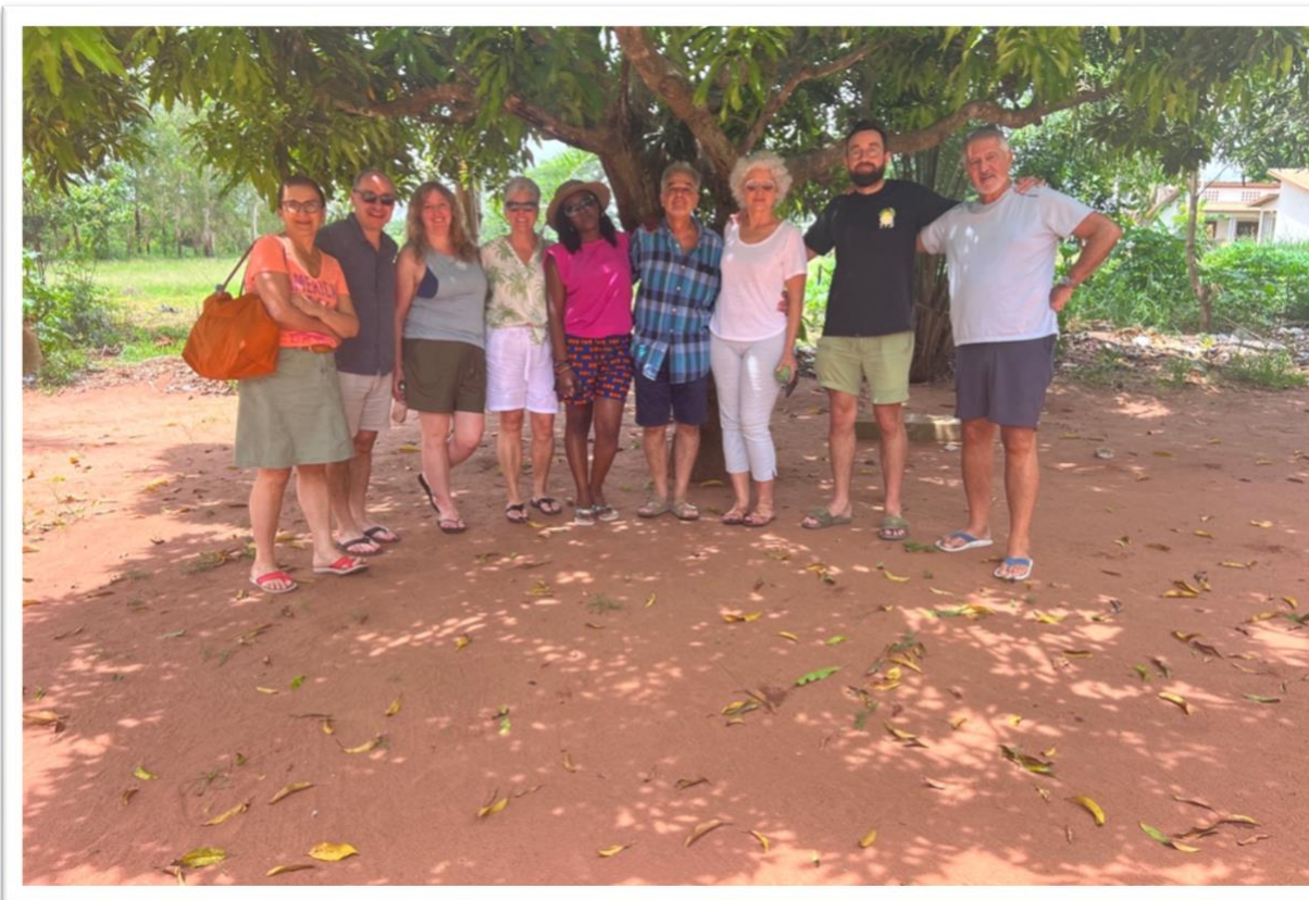
L'équipe de MMS pose devant le terrain offert par le gouvernement togolais pour construire l'hôpital des femmes de Tsévié